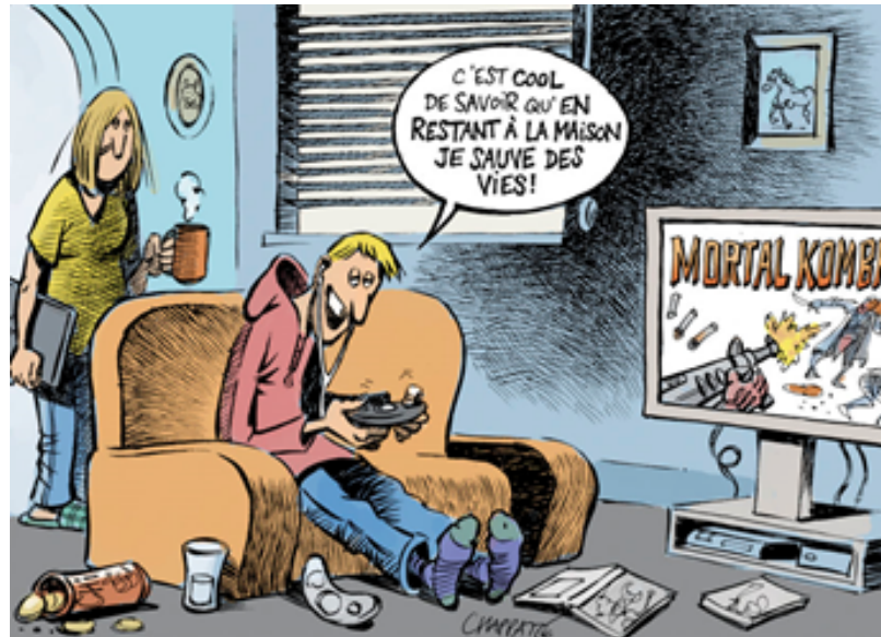
CHAPATTE, SUISSE, LE TEMPS