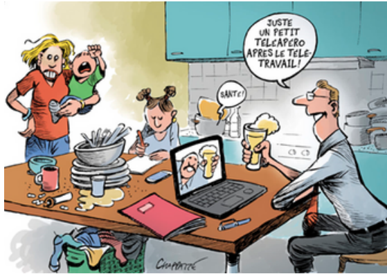
CHAPATTE, SUISSE, LE TEMPS