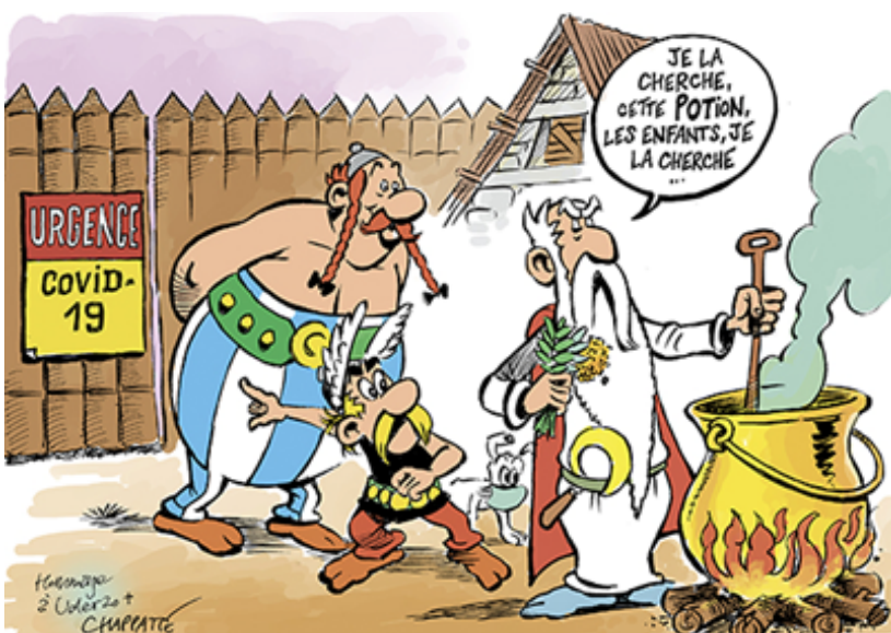
CHAPATTE, SUISSE, LE TEMPS