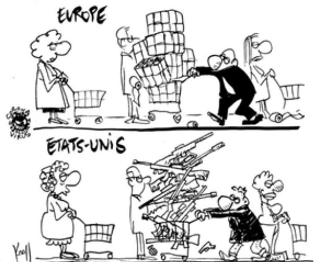
KROLL, BELGIQUE, LE SOIR