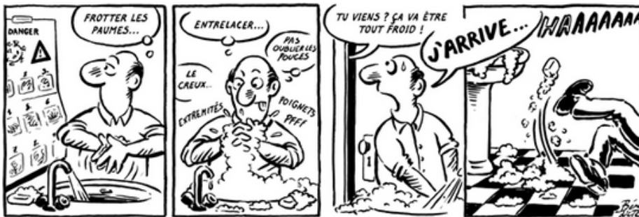
BÉNÉDICTE, FRANCE, VIGUSSE

LES BULLETINS MÉTÉO, C'ÉTAIT MIEUX AVANT